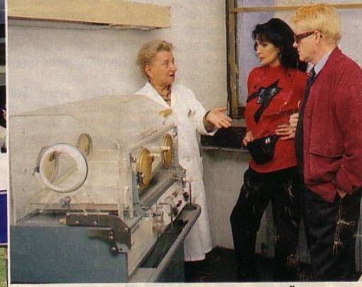
Nur unter schwersten Bedingungen können Ärzte und Pfleger in ihrem Krankenhaus arbeiten. Bomben und Granaten haben ihre Klinik mehrfach getroffen, die kranken Kinder wurden in den Keller evakuiert